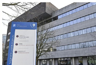
Twee weken geleden gemiddeld bekend dat het computerlabo van het Ziekenhuis Middelheim in Rotterdam werd gehackt.